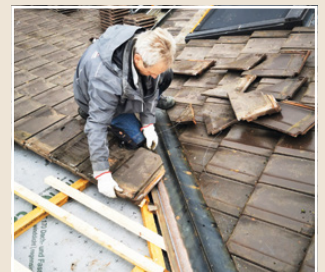
Der Fachmann beim Einbau des Marder Protect™ Universal